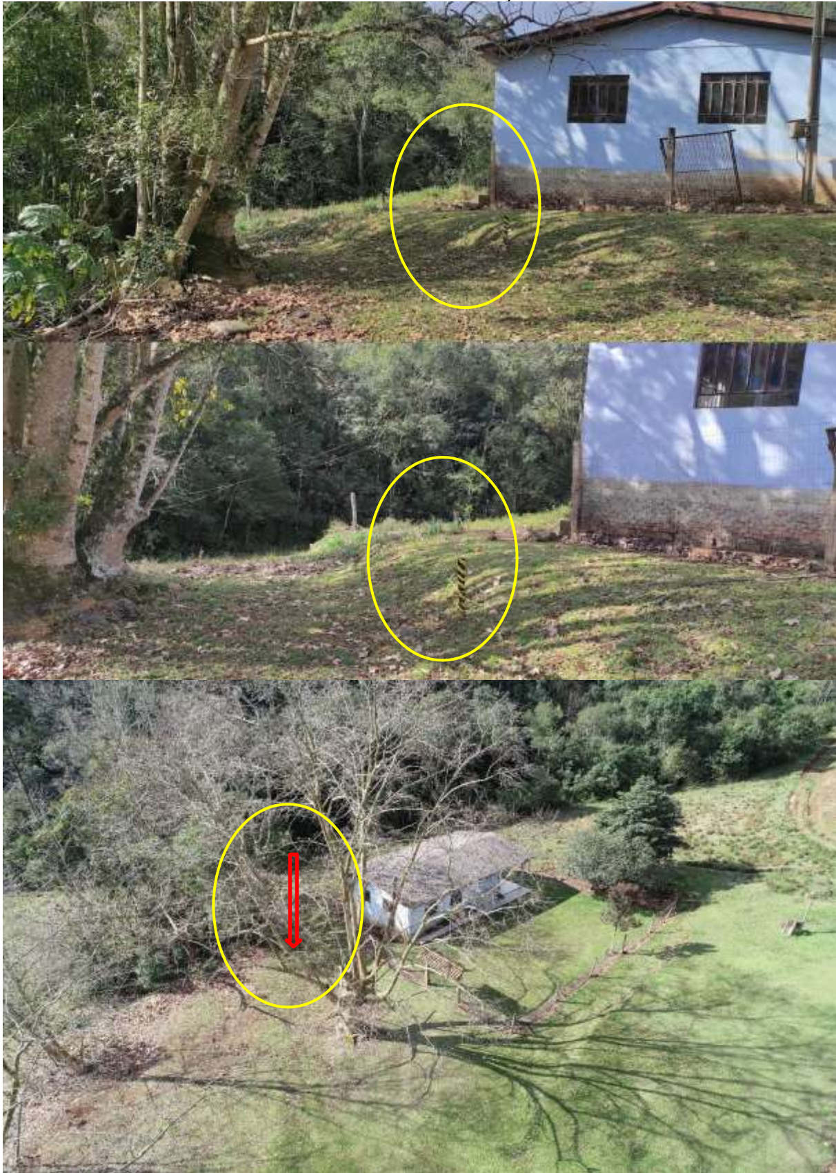
Figura 04 – Local estaqueado para perfuração.